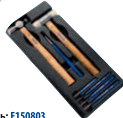
Модуль: E150803 Пустой ложемент: E010507 Страница: 140