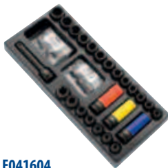
Модуль: E041604 Пустой ложемент: E041606 Страница: 85