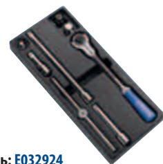
Модуль: E032924 Пустой ложемент: E032925 Страница: 67