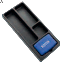
Пустой ложемент: E131704