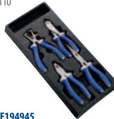
Модуль: E194945 Пустой ложемент: E010502 Страница: 126