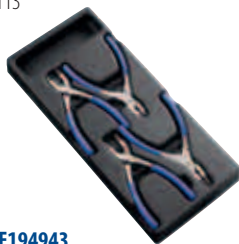
Модуль: E194943 Пустой ложемент: E010503 Страница: 130