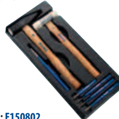
Модуль: E150802 Пустой ложемент: E010506 Страница: 140