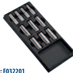
Модуль: E032201 Пустой ложемент: E010515 Страница: 67