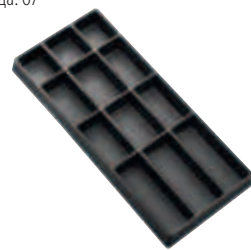
Пустой ложемент: E010516