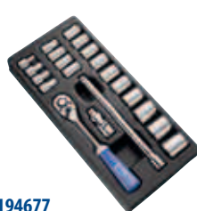
Модуль: E194677 Страница: 67