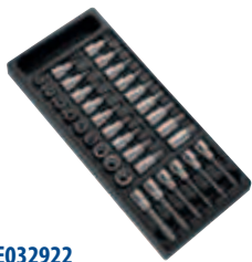
Модуль: E032922 Пустой ложемент: E032923 Страница: 66