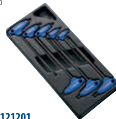
Модуль: E121201 Пустой ложемент: E121205 Страница: 110