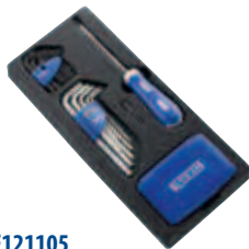
Модуль: E121105 Пустой ложемент: E121106 Страница: 113