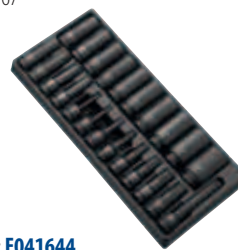
Модуль: E041644 Пустой ложемент: E041645 Страница: 86