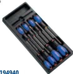
Модуль: E194940 Пустой ложемент: E160916 Страница: 97