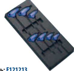
Модуль: E121213 Пустой ложемент: E121214 Страница: 112