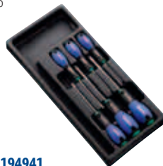
Модуль: E194941 Пустой ложемент: E160917 Страница: 97