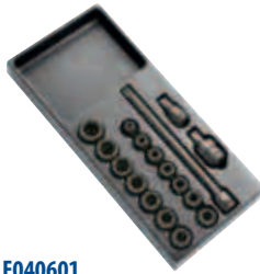
Модуль: E040601 Пустой ложемент: E040602 Страница: 86