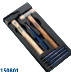
Модуль: E150801 Пустой ложемент: E010501 Страница: 140